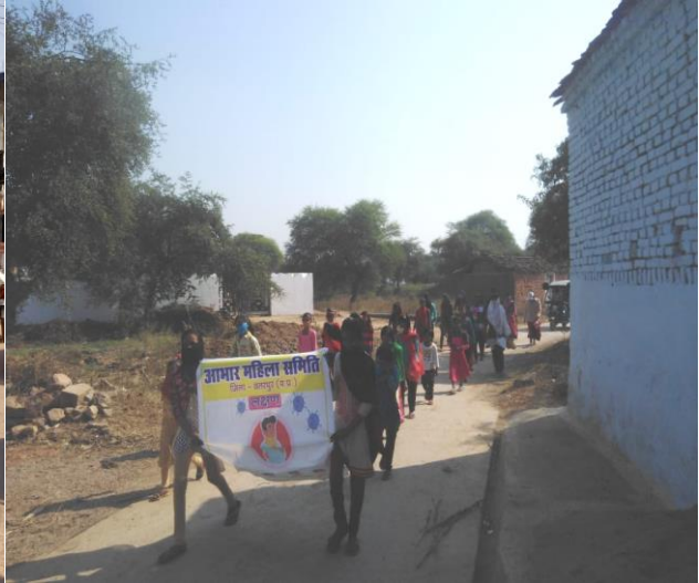
आभार महिला समिति छतरपुर केविड 19 रिपोर्ट